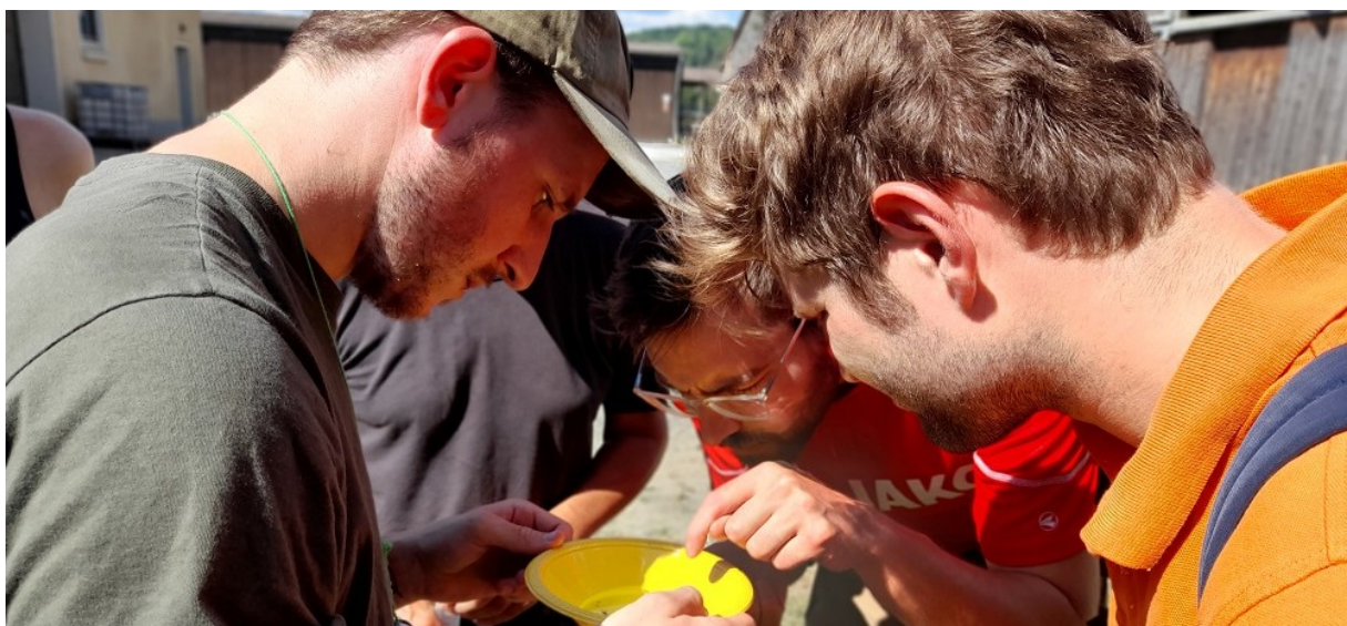
Exkursionsteilnehmer studieren die mithilfe einer Gelbschale gesammelten Hautflügler